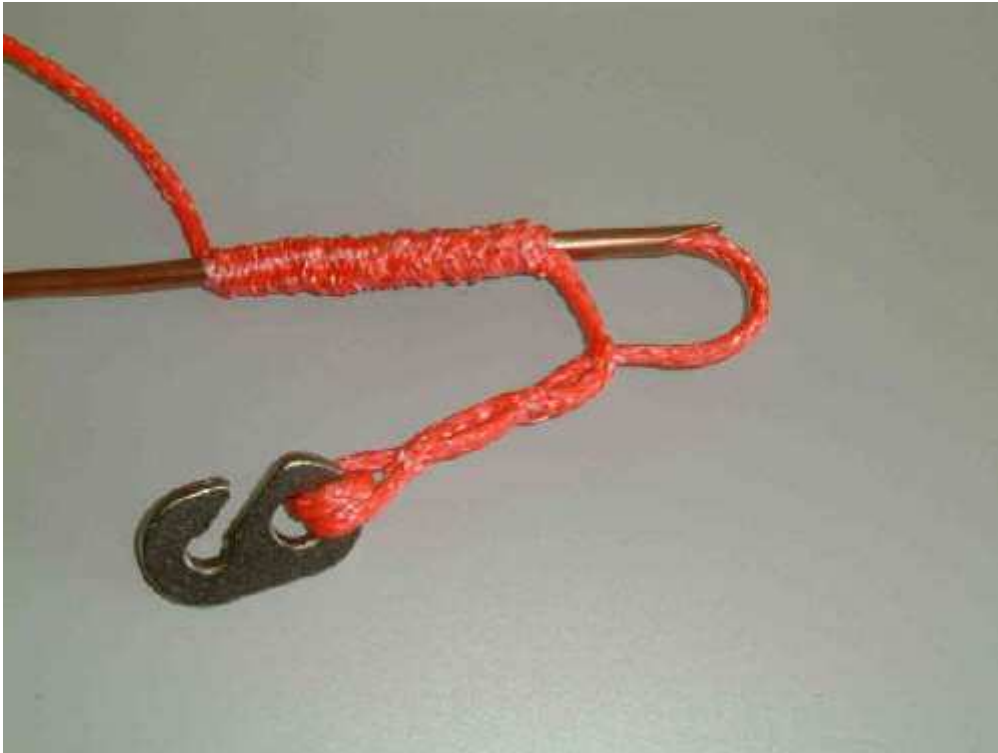
A szabad kötélvéget a tűbe fűzve a megvastagított részen...