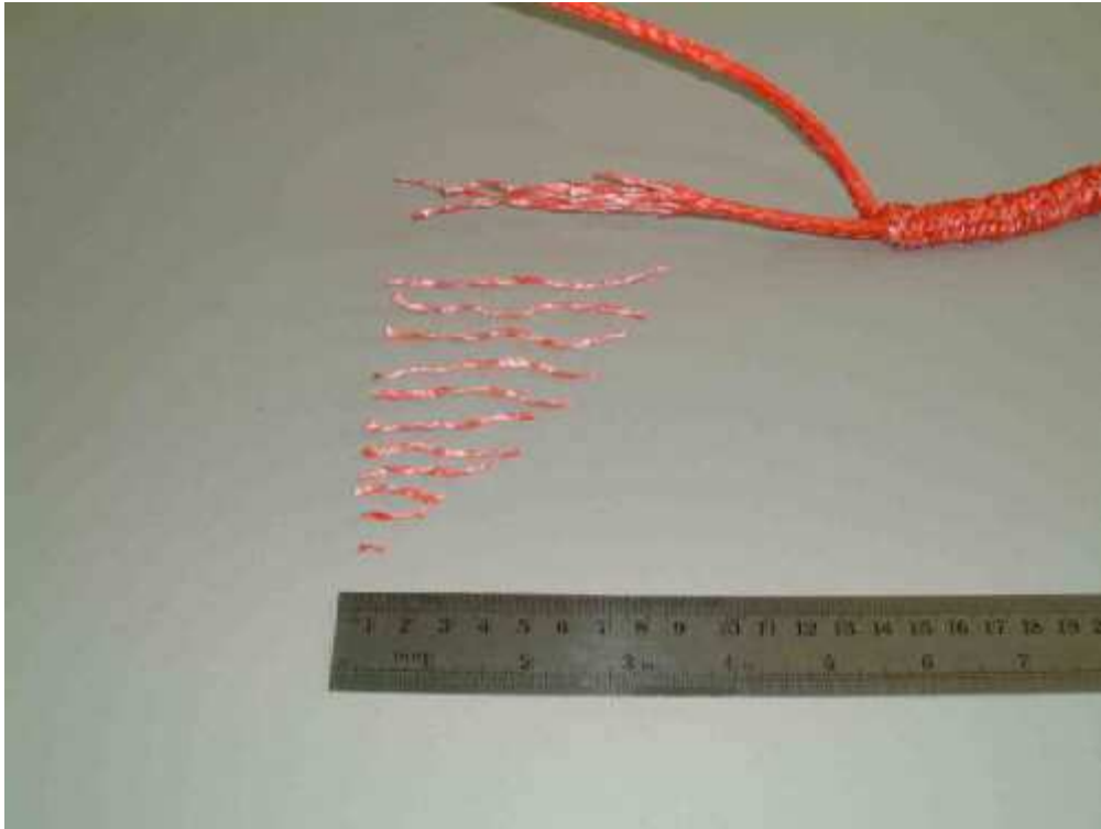
A kötélt utolsó 10 cm-ét elvékonyítani,