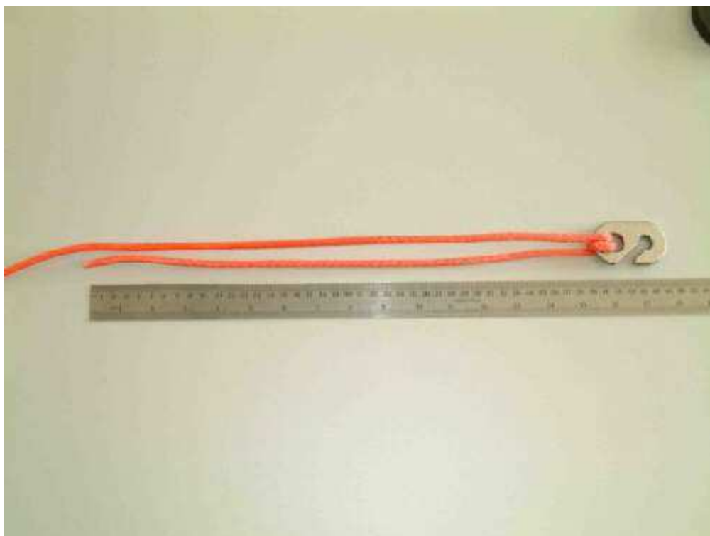
Fonási hossz: 40 cm