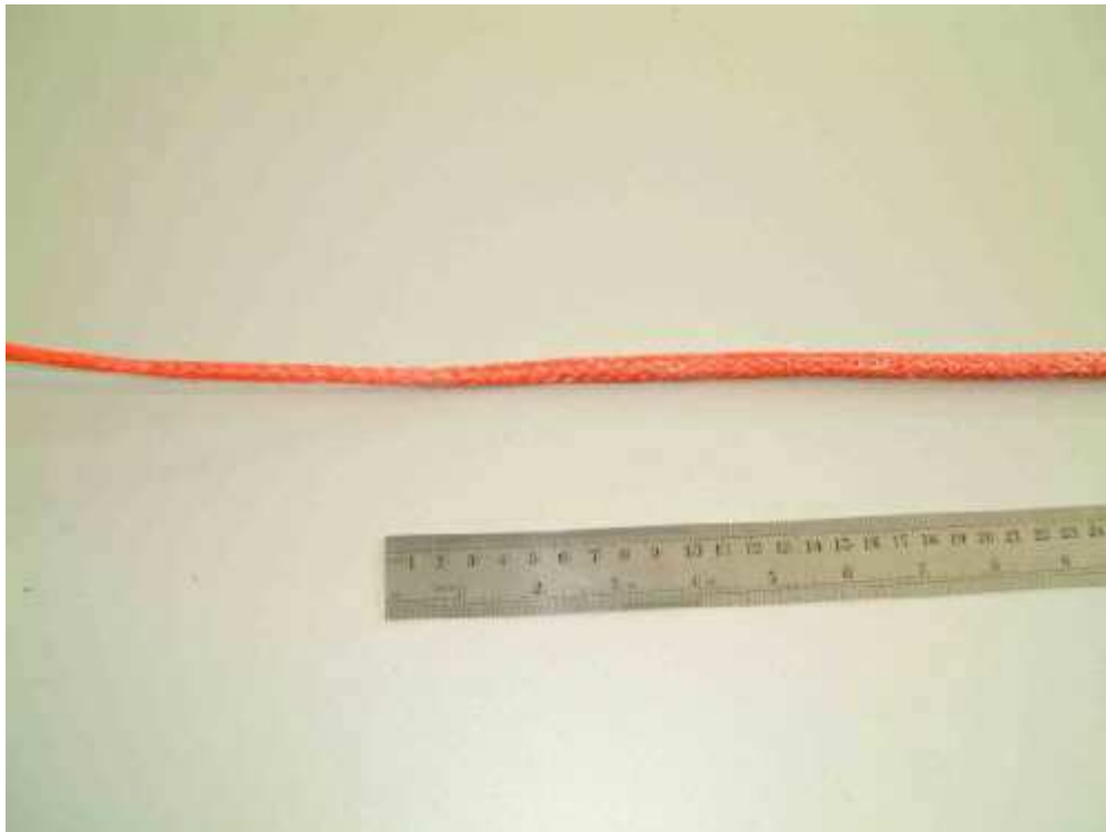
Az összenyomott kötélrészt ismét feszesre húzva, a szabad kötélvég behúzódik a kötélt belsejébe.